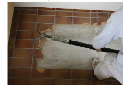
Déposer du carrelage