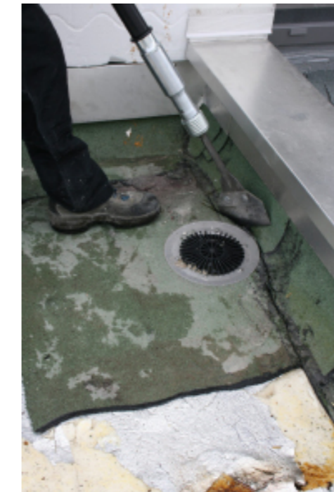
Gratter le parapet