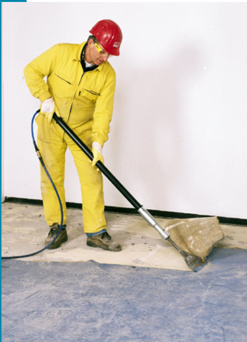
Enlever de la moquette / linoléum