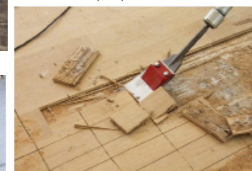
Enlever un revêtement phonique