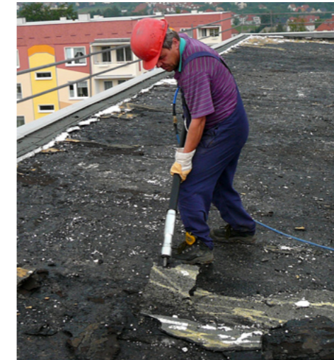
Enlever des revêtements bitumeux - Debout